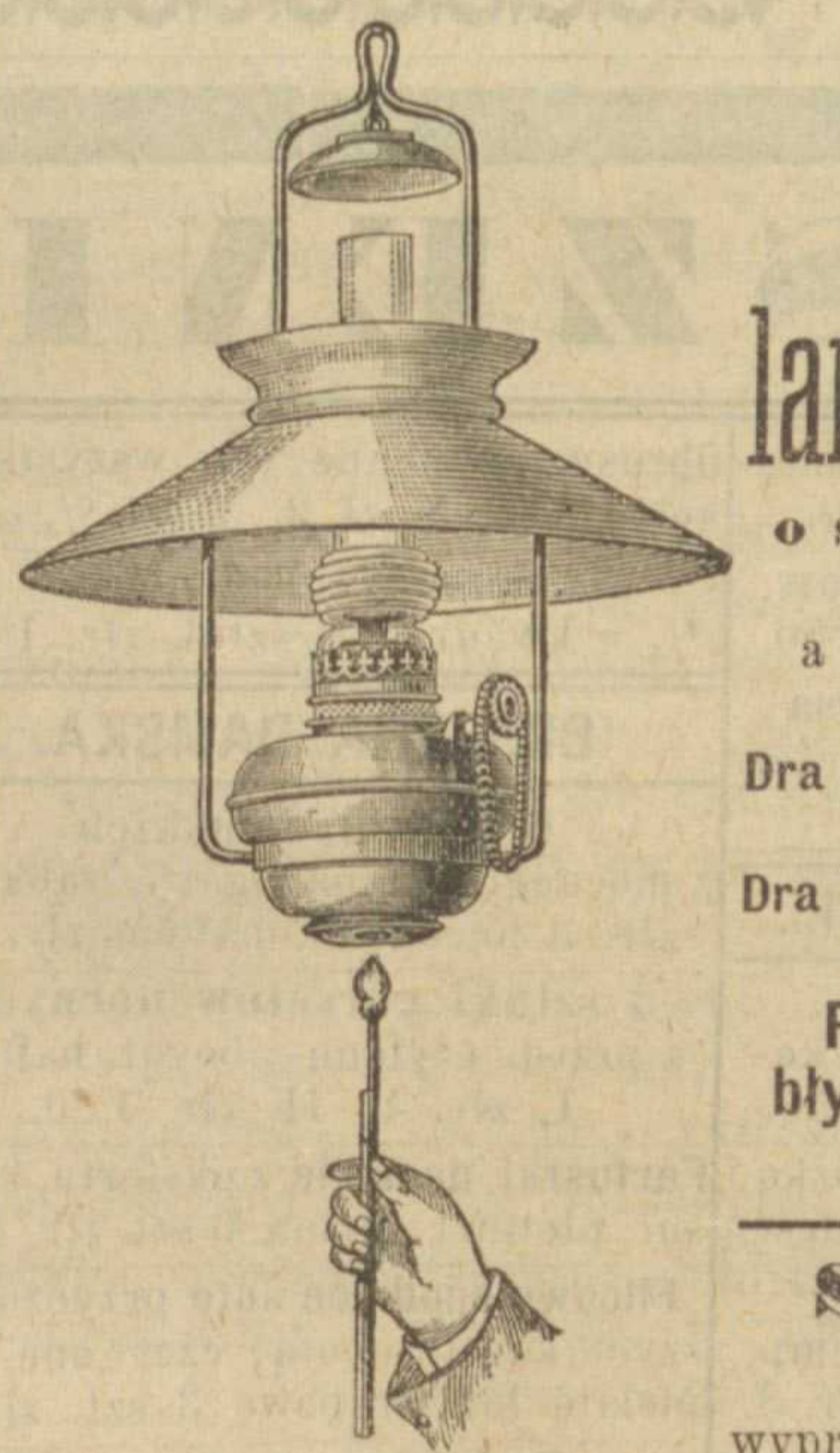
Wiedeńska Lampa błyskawiczna 30".