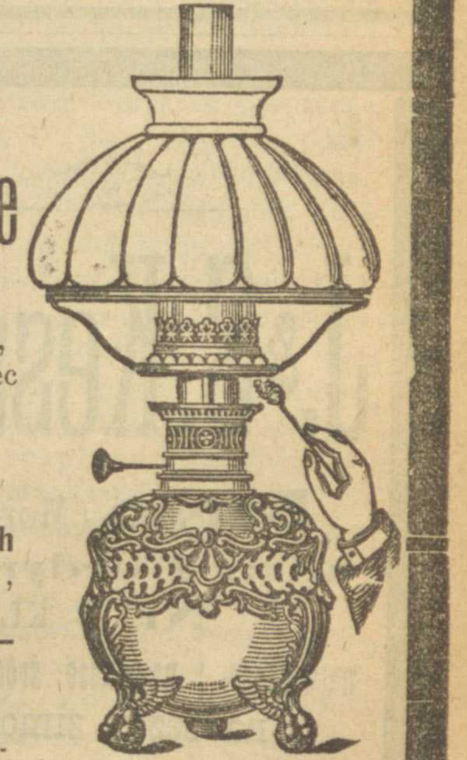
Lampa na stół z palnikiem brylantowo-meteorowym.

R. DITMARA Palniki brylantowo-meteorowe o kulistym płomieniu w wielkości: 15", 20", 25", 30", o sile świetlnej: 31 50 70 80 świec w wielkości: 25", 45", o sile świetlnej: 138 157 świec są zastosowane do stojących, wiszących i ściennych Lamp, jak również do żyrandoli, Latarni i t. p.